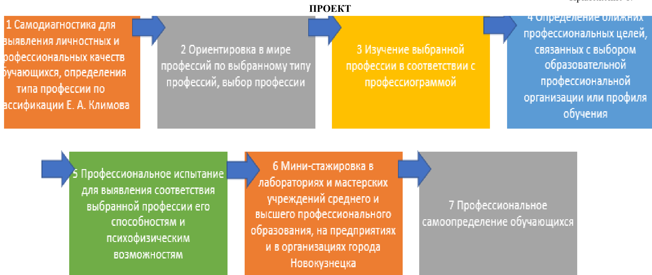
Рисунок 1- Модель маршрута профессионального самоопределения обучающихся с использованием профориентационной онлайн-платформы «ПРОФагентство «Траектория42»