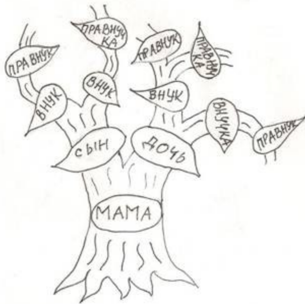
Рисунок «Мое генеалогическое дерево»

(Педагог показывает рисунок на котором изображено генеалогическое дерево).